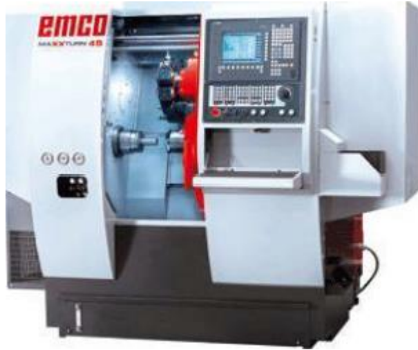
TORNO EMCO-TURN-365 MC TORNO EMCO MAT-E200